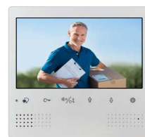
1 moniteur couleur 18 cm à touches sensibles