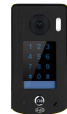
1 platine de rue Inox noire avec visière anti-pluie