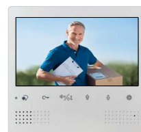
1 moniteur couleur 18 cm à touches sensibles